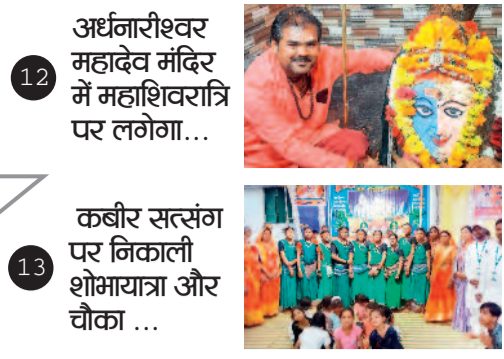
12 अर्धनारीश्वर महादेव मंदिर में महाशिवरात्रि पर लगेगा...