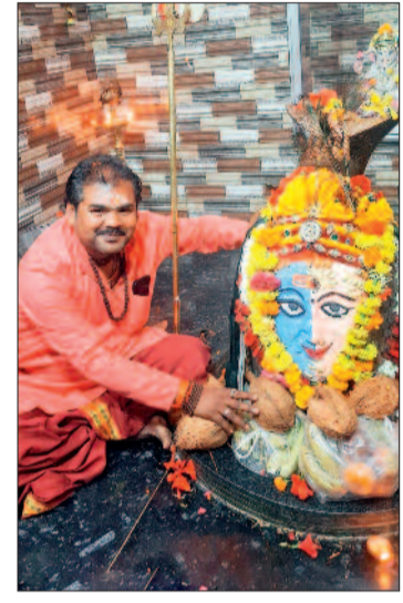
हरिभूमि न्यूज ►► खरोरा

महाशिवरात्रि पर खरोरा क्षेत्र के ग्राम बेल्दर सिवनी में स्थित लगभग 250 वर्ष पुराने प्राचीन अर्धनारीश्वर महादेव मंदिर में 14 एवं 15 फरवरी को दो दिवसीय भव्य मड़ई मेले का आयोजन होगा। इस अवसर पर विशेष पूजा-अर्चना, जल अभिषेक, दर्शन एवं रात्रिकालीन सांस्कृतिक कार्यक्रम आयोजित किए जाएंगे। आयोजन को लेकर ग्रामवासियों एवं श्रद्धालुओं में उत्साह का माहौल है और क्षेत्र सहित दूर-दराज के गांवों से बड़ी संख्या में श्रद्धालुओं के पहुंचने की संभावना है।