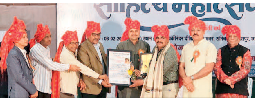
हरिभूमि न्यूज ►► सिमगा